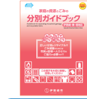
Phiên bản dành cho Iseesaki-Azuma-Khu vực Sakai

Bản hướng dẫn phân chia rác và rác tài nguyên