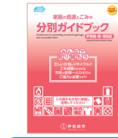
Phiên bản dành cho Isesaki-Azuma-Khu vực Sakai

Bản hướng dẫn phân chia rác và rác tài nguyên