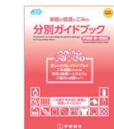
伊势崎 / 东 / 境地区版