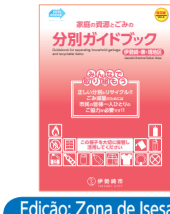
Edição: Zona de Isesaki, Azuma, Sakai

Guia de separação de lixos e materiais recicláveis