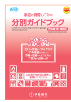
Edição: Zona de Iseaki, Azuma, Sakai

Guia de separação de lixos e materiais recicláveis