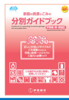
Versión de Isesaki, Azuma y Sakai