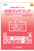
Versión de Iseaki, Azuma y Sakai