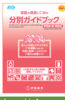
Isesaki・Azuma・Lugar ng Sakai