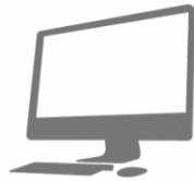
デスクトップパソコン