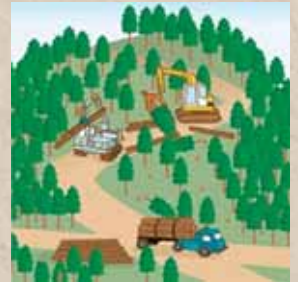
適切に森林整備を推進！

ことから、森林の土地の所有者の把握を進めるため、平成24年4月から森林法に基づく森林の土地の所有者となった旨の届出制度が創設されました。なお、この届出により、森林の土地の所有権の帰属が確定されるものではありません。