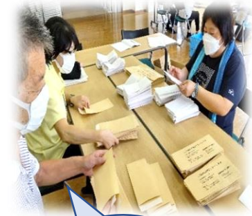
アンケート 発送作業