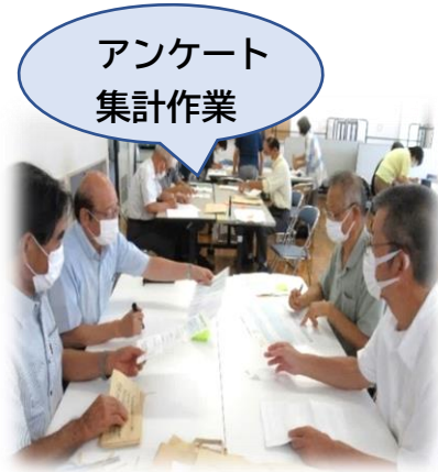
アンケート 集計作業