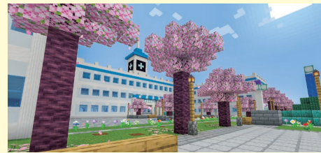
理想の小学校を想像！

マイクラフトで理想の小学校を自由に想像して表現してください。 「こんな学校があったらいいな」「未来にはこんな学校になるかもしれない」など、あなた自身のアイデアで、小学校の建物や校庭、体育館などを創造してみてください。