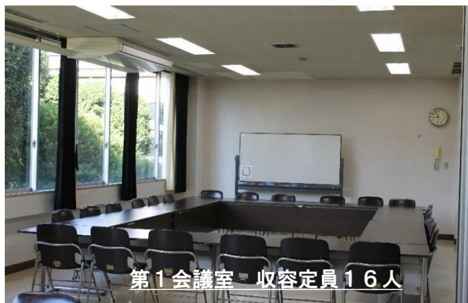
第1会議室 収容定員16人