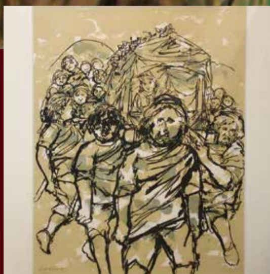
卑弥呼初めて宮室に入る