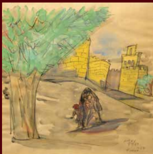
スペイン アヴィラ