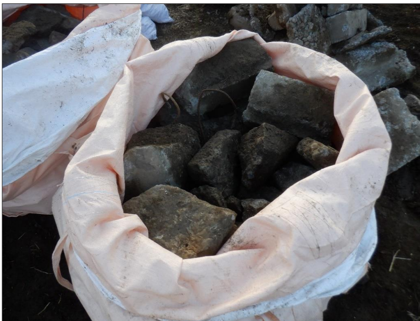
埋設物 コンクリート殻