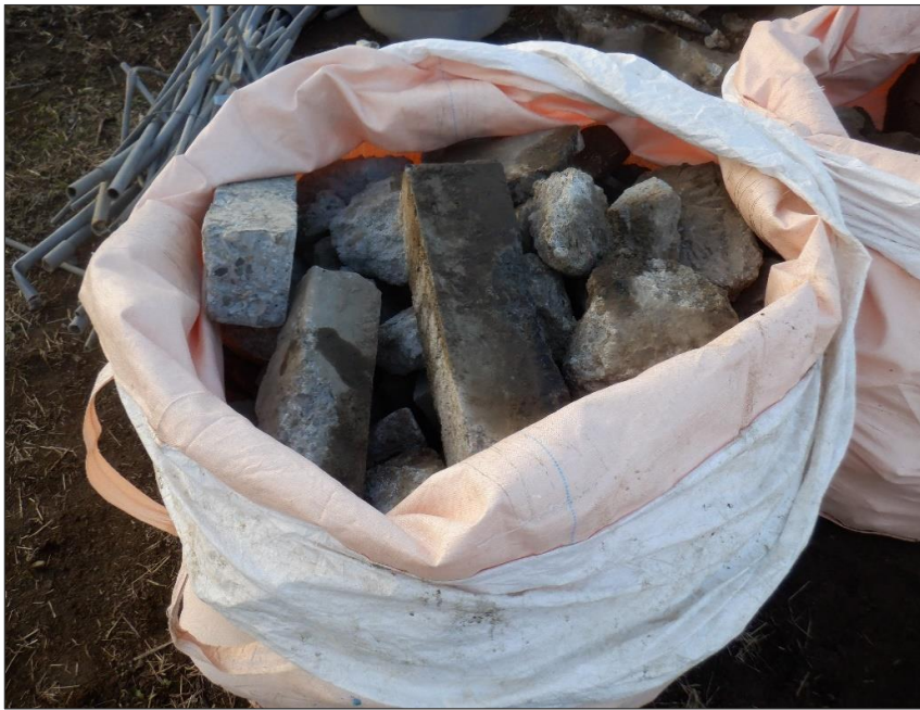
埋設物 コンクリート殻