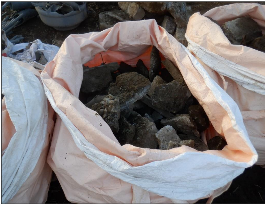
埋設物 コンクリート殻