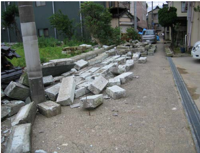
地震により石塀が倒壊（道路をふさぐ）