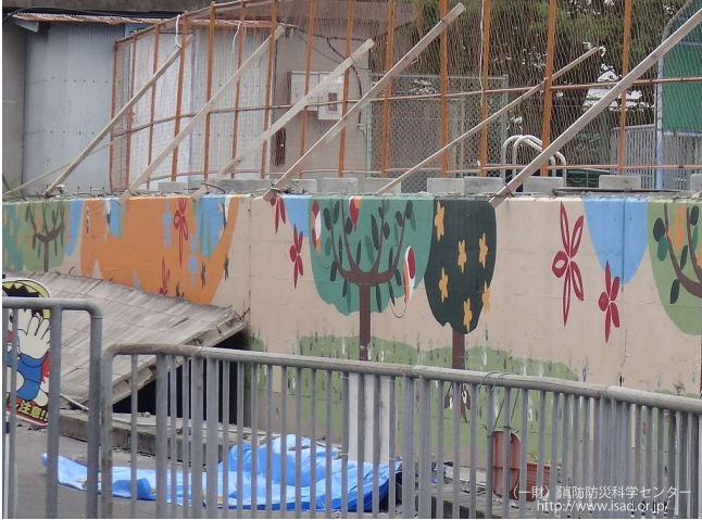
H30.6大阪府北部地震により小学校の ブロック塀が倒壊（小学生が亡くなる）