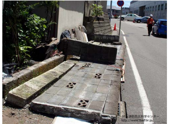
地震によりブロック塀が倒壊