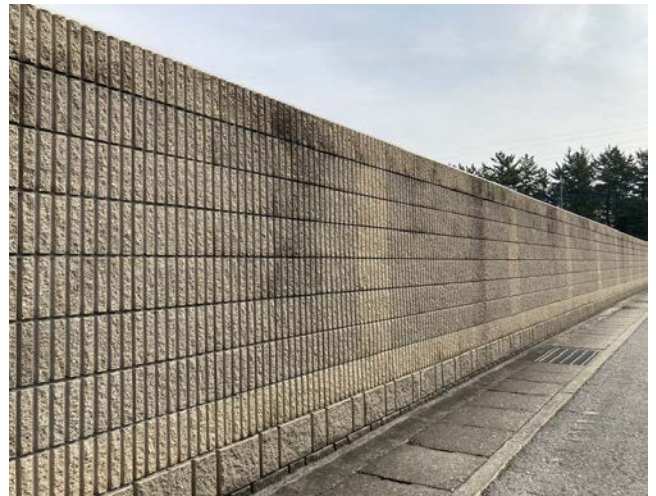
このように化粧された塀もブロック塀です