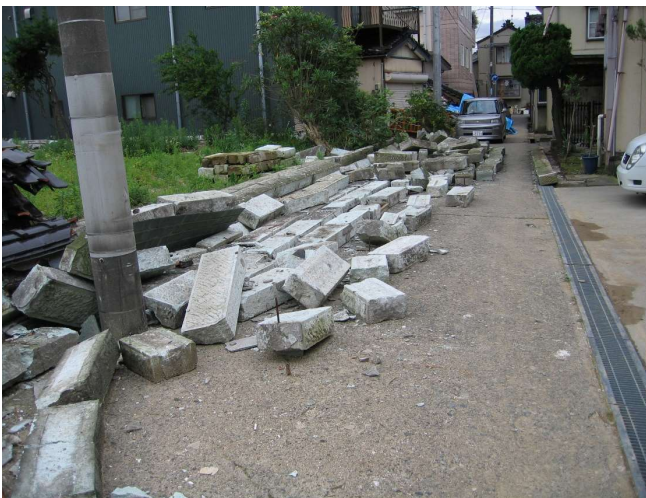
地震により石塀が倒壊（道路をふさぐ）