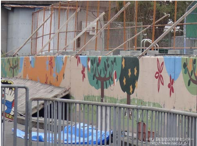
H30.6大阪府北部地震により小学校の ブロック塀が倒壊（小学生が亡くなる）