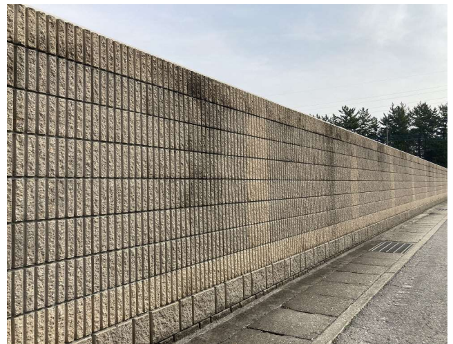
このように化粧された塀もブロック塀です