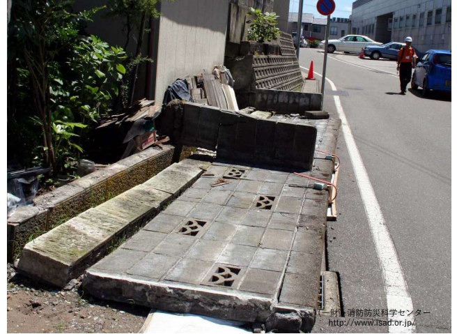
地震によりブロック塀が倒壊