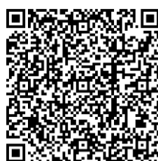
伊勢崎市HP 「市営住宅への入居」