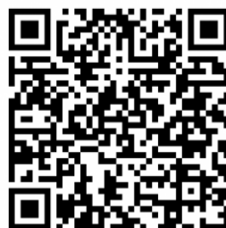
伊勢崎市HP 「市営住宅への入居」