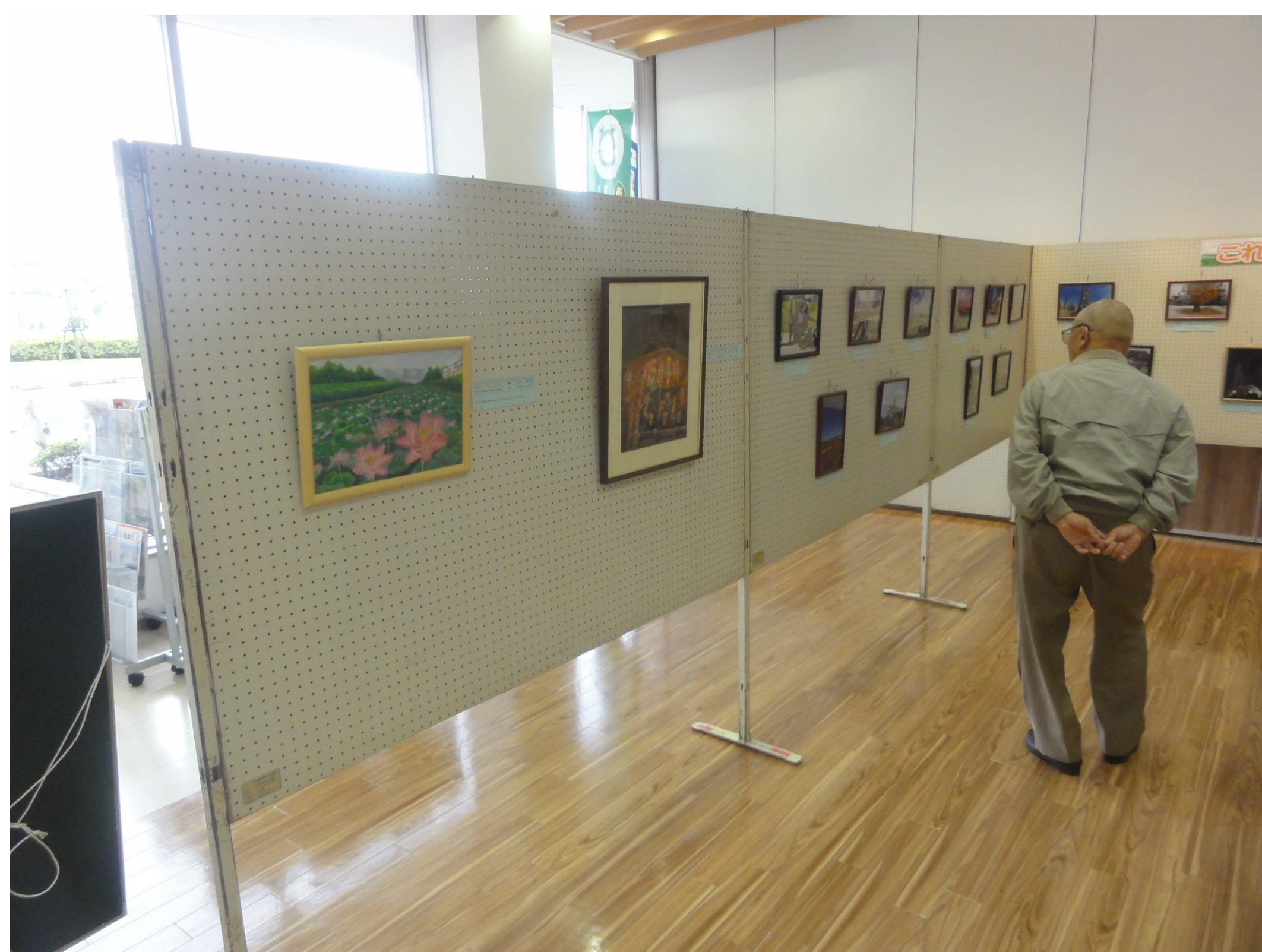
▶ 駅前インフォメーションセンター