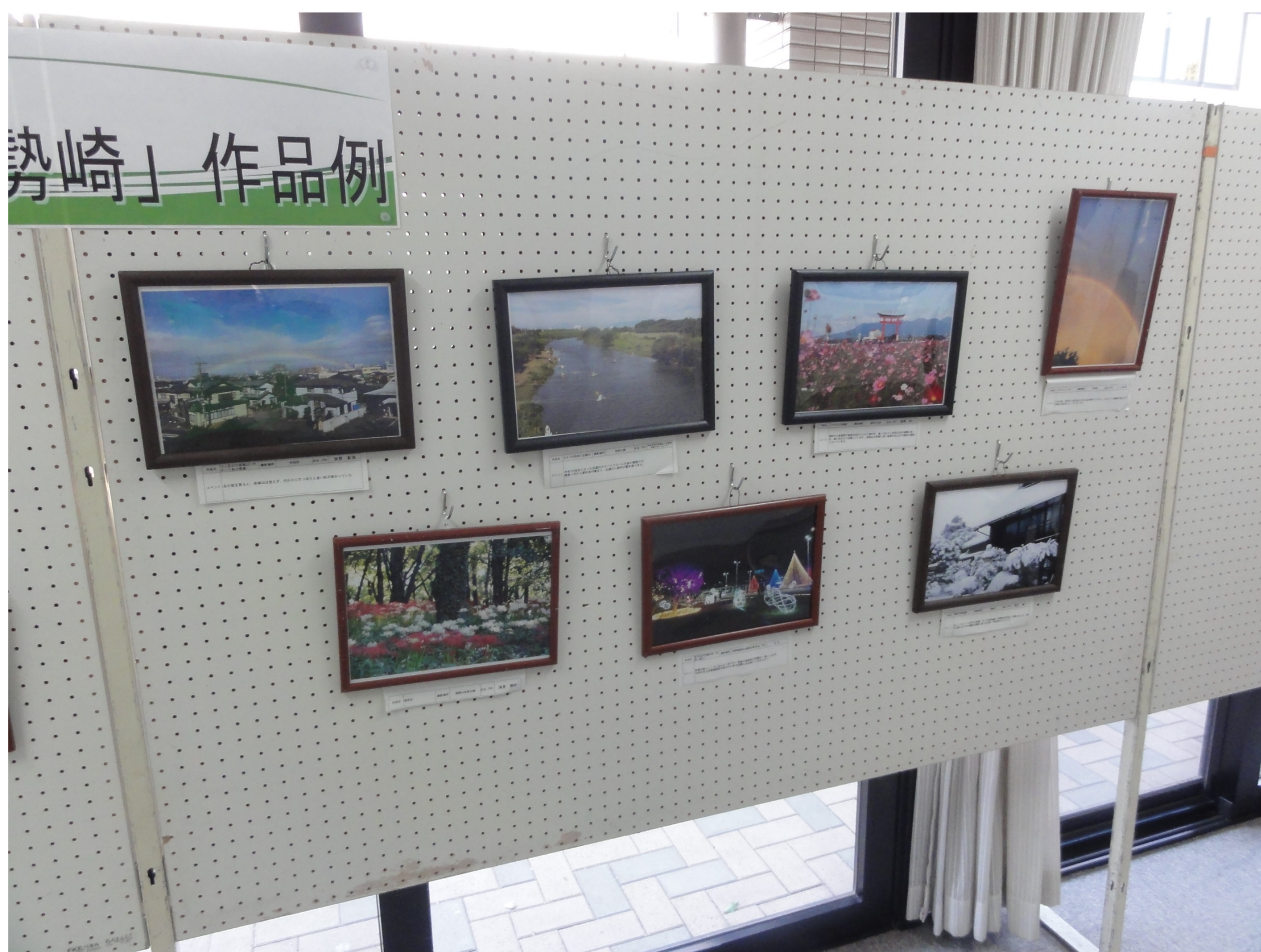
▶ 境総合文化センター