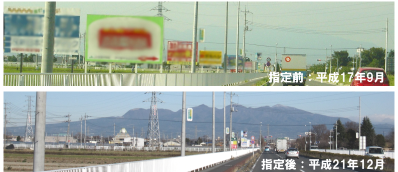
禁止地域指定範囲の状況写真

新たな禁止地域の指定範囲は、坂東大橋石山線とその沿道50m以内の区域で、延長約1km（下図）です。この範囲では、山々の輪郭線と田園の広がりによって構成される景観を維持するため、平成21年12月1日以降、原則として屋外広告物の表示・設置ができなくなりました。この禁止地域指定範囲の状況写真は右のとおりであり、是正指導によって違反広告物の除却が進んでいます。