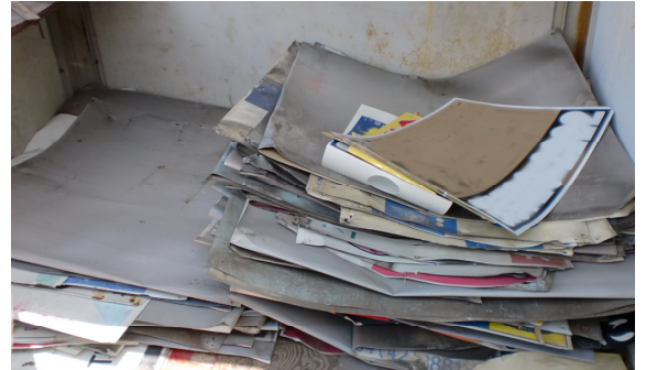
除却した塀のはり札の例

本市は、 良好な景観の形成および公衆に対する危害防止 に向けた取り組みとして、塀に表示されている違反簡易広告物を、塀の所有者の了解を得た上で、 随時除却しています。