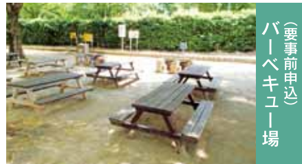
バーベキュー場 (要事前申込)

子供のもり公園伊勢崎まゆドームは、身近な自然の中で子供たちがのびのびと遊び、学べる施設です。公園内には、すべり台やブランコ、岩山を模したぼうけん山や芝生の広場などがあり、木陰やベンチで休むこともできます。井戸水を使った川の流れて、ピオトープを構成しています。まゆドームでは、ボールや輪投げ、グラウンドゴルフ等の遊具の貸し出しもしています。持ち帰りはできませんが、トンボやチョウ、クワガタなど虫取り網で捕まえて観察することもできます。友達や家族と、自然の中で楽しいひとときをお過ごしください。