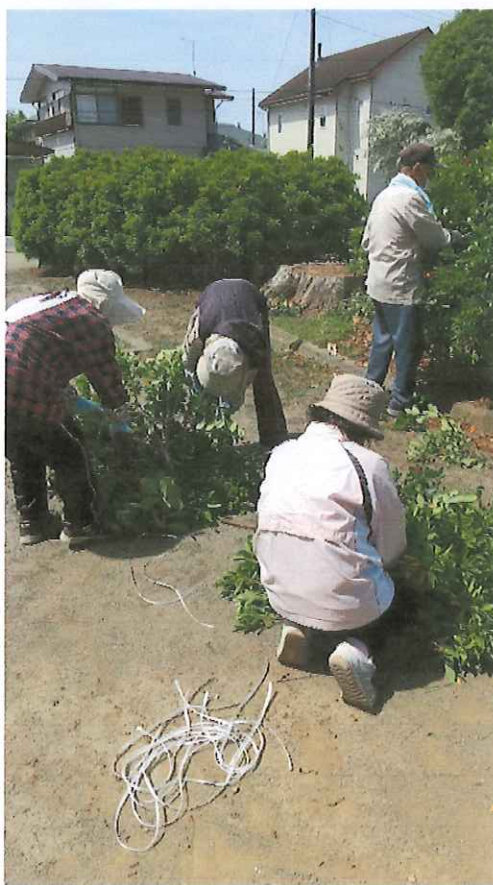
剪定枝整理作業状況