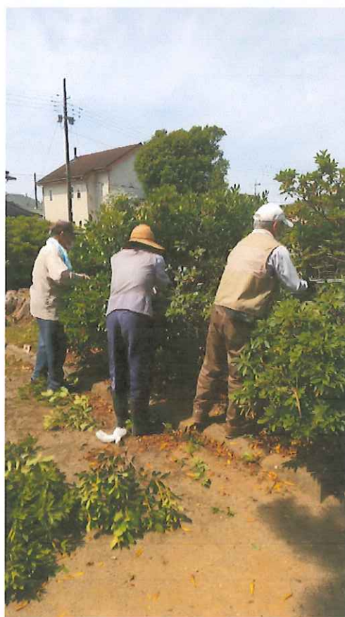
刈込剪定作業状況