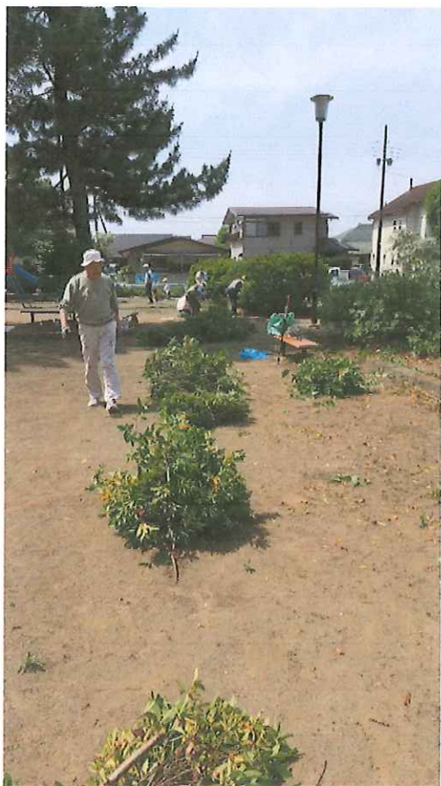
刈込剪定作業状況