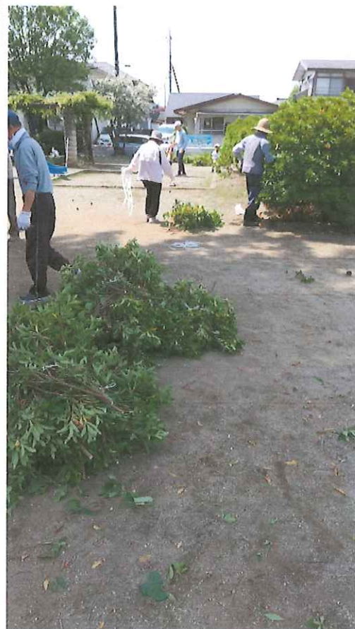
刈込剪定作業状況