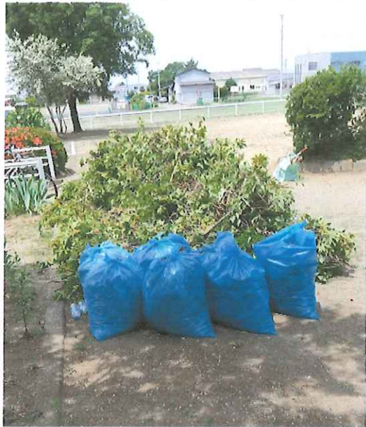
剪定枝葉の整理 枝 60束 葉・切枝 7袋