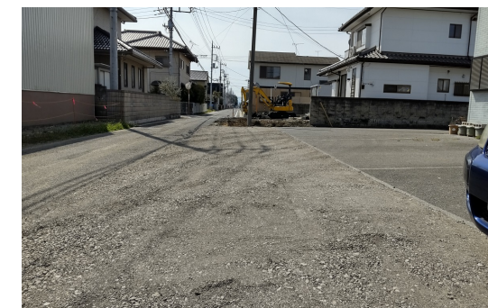
① 既存道路の拡幅工事を実施します