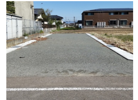
② 新設道路工事を実施します

地区内の通行等につきましてご迷惑をおかけしておりますがご理解・ご協力をお願いします。