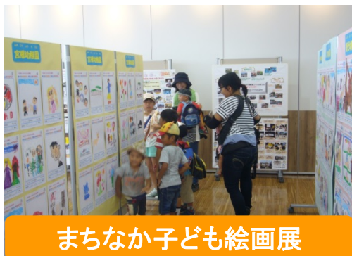
まちなか子ども絵画展