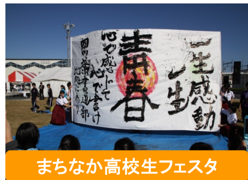
まちなか高校生フェスタ