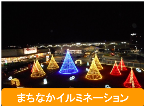
まちなかイルミネーション