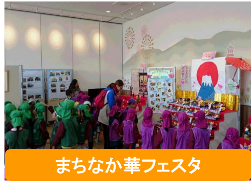
まちなか華フェスタ

■伊勢崎駅周辺のまちづくりに関するお問合せ 事業の内容等について、お気軽にお問合せください。