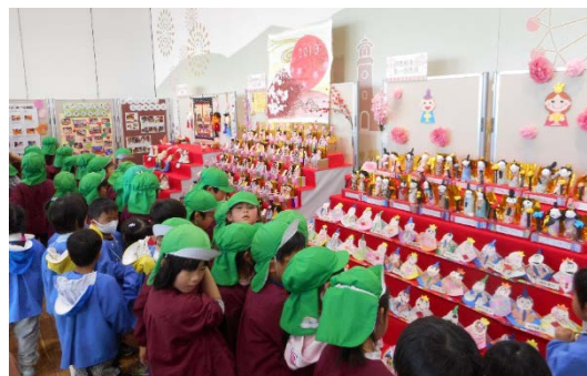
まちなか華フェスタ

■伊勢崎駅周辺のまちづくりに関するお問合せ 事業の内容等について、お気軽にお問合せください。