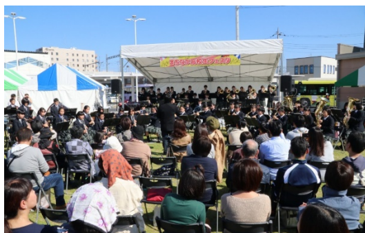
まちなか高校生フェスタ