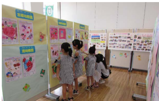
まちなか子ども絵画展