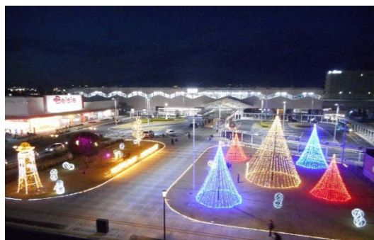
まちなかイルミネーション