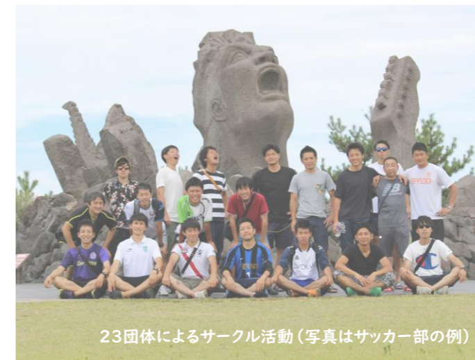
23団体によるサークル活動(写真はサッカー部の例)