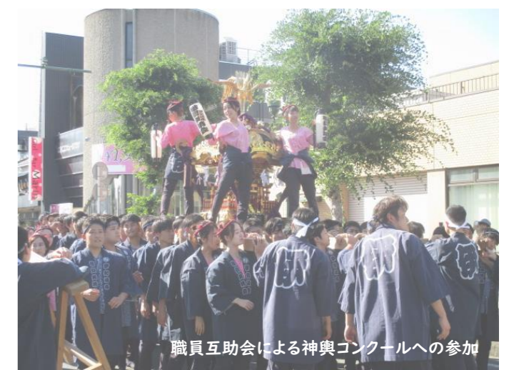
職員互助会による神輿コンクールへの参加