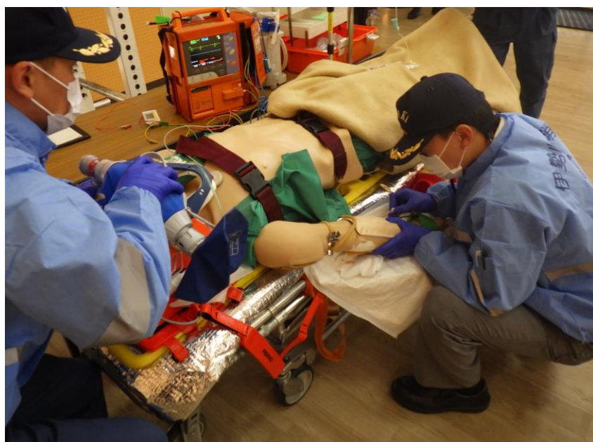
令和4年度 救急隊員生涯教育効果確認訓練 開催地：伊勢崎市消防本部