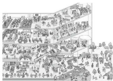
これからの時代にふさわしい図書館を