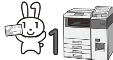
コンビニ交付サービス

農林水産業費 問 農業費のうち、担い手育成総合支援事業負担金の内容は。 答 佐波伊勢崎地域担い手育成総合支援協議会が行う、担い手の支援に係る事業270万円とブランド化の推進等に係る事業330万円、合計600万円の事業費に対し、本市が362万1000円、佐波伊勢崎農業協同組合が189万円、玉村町が48万9000円を負担するものです。