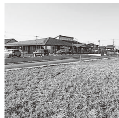
活用方法に要望が多い豊受公民館周辺

● 豊受地区における産業団地について ● 不登校対策について ● 市民病院における医療DX令和ヒジヨン2030への対応について