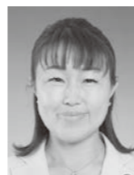
会 志 有 小 暮 笑 鯉 子

答 中学2年生を対象に、保護者及び生徒本人の同意が得られた場合に、貧血検査を実施しています。検査の結果で、受診が必要な生徒は、速やかに医療機関への受診を勧奨するなど適切な事後措置をして、貧血検査の結果も活用しながら、保健体育や家庭科の授業を中心に指導をしています。また、フ