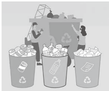
ごみの分別によるごみの減量化を