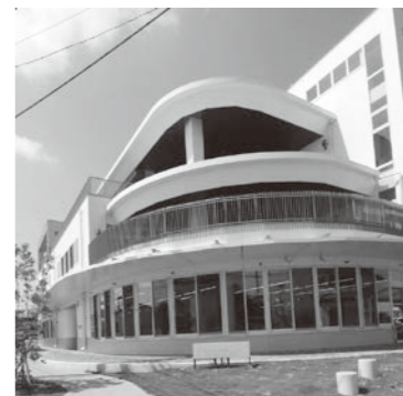
くわまるプラザ (保健センター)

歳出 総務費 問 企画費のうち、女性活躍職場環境づくり補助金の内容、補助額及び対象は。 答 男女共同参画社会の実現及び女性活躍推進に資することを目的として、女性が活躍できる職場環境を整備するための3万円以上の工事費及び備品購入費に対し3分の2以内の額を補助するもので、上限を1事業者50万円とし、中小企業者等を対象とするものです。