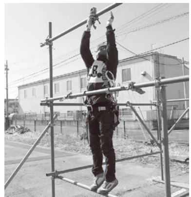
現場技術者の育成は喫緊の課題