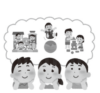
縮充の先にある夢のある公共施設を

問 パーキンソン病の専門的治療とリハビリテーションを一体的に提供する拠点を有する本市が、医療と介護、健診と専門医療機関をつなぐ仕組みを制度として整理できれば、全国モデルになり得ると考える。専門医療機関と連携し、パーキンソン病に強いまちづくりを進めていく考えは。 答 市民への適切な情報提供や保健師等の専門職を対象とした研修の実施など、各段階においてどのような連携ができるか、今後調査研究していきます。