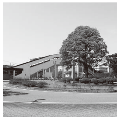
さらなる増便と境町駅北口の新設を

問 境町駅北側は、駅前ロータリーと駐輪場はあるが、改札等の駅機能を利用するには跨線橋である南北連絡通路