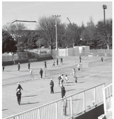
健康増進拠点の華蔵寺公園運動施設

問 波志江スマートICを含めた市北西部エリア全体を、今後どのように整備誘導していくのか。答 広域交通網の玄関口となる波志江スマートIC周辺を含めて、県の土地利用方針との整合性をはじめ、周辺環境や営農環境との調和の下、産業系の土地利用誘導の可能性も長期的な視野に入れた観光・レクリエーションの拠点となる地域を目指していきたいと考えています。