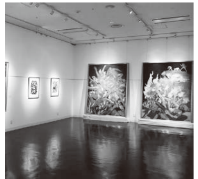
郷土の芸術文化振興のために美術館を

問 健康的でロマンあふれる文化芸術の拠点の広場を有するまち、未来の子供たちに誇れる伊勢崎市のまちを願うための要望や期待に応えるためにも美術館構想策定検討委員会の設置の必要性を感じるが、設置の考えは。 答 現段階では設置は考えていませんが、令和8年度には、全庁横断的な組織の調整を行う市長戦略部に公有財産のさらなる有効活用を図るための担当課を新設することから、関係部署間の連携を図りつつ段階的に設置について協議、検討していきます。