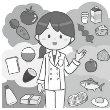
貧血検査の結果を活用した食育指導を