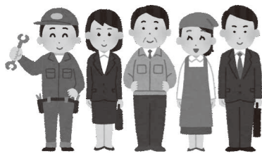
市内企業が力強く発展する施策を