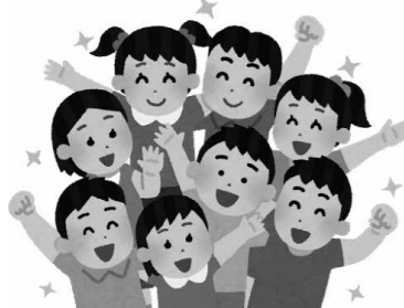
子供たちの意見を反映した施策を

問 本市のこども施策に対する子供たちの意見の聴取方法は、また、その意見を反映するための具体的な構想は。 答 本市独自の取組として、(仮称)こども座談会の開催を予定しています。長期休業期間を利用し、市内の放課後