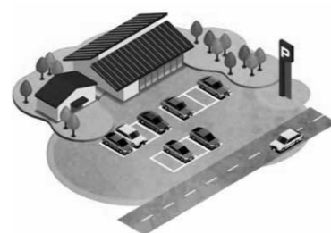
道の駅により地域への経済効果を

答 道の駅の設置をめぐることは、主要幹線道路からの誘客を狙って、民間企業の主体による地域振興型の複合的な大型集客施設も現れるなど外部環境が大きく変化しています。本市への道の駅の設置については、周辺自治体が設置する道の駅または民間企業が整備す