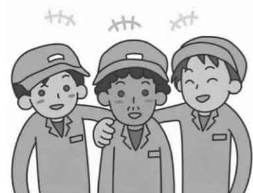
外国人労働力の確保を

問 国は現行の技能実習制度を見直し、即戦力の労働力として受け入れ、最長5年働ける特定技能1号、さらに熟練外国人技術者として永住や家族帯同が認められる在留資格、特定技能2号と