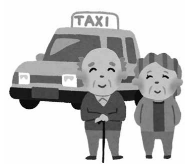
誰もが安心して利用できる移動手段を