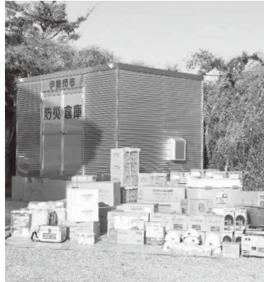
防災倉庫にある備蓄品の適正管理を