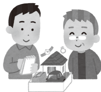
成年後見制度の利用促進を

成年後見制度利用促進の取組は。裁判所への申立て費用の助成及び弁護士等の専門職への報酬支払いにおける市の立替えに係る費用を予算計上しています。