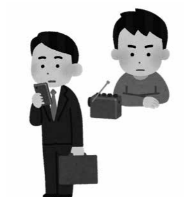
災害時でも早急に的確な情報伝達を