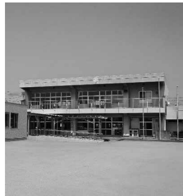
直営化により支援体制の充実を