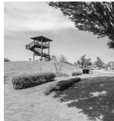
環境に対応した公園の除草管理を