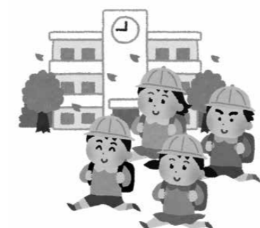
児童・生徒の安全を確保した通学路を

答 毎年4月に各学校園に対して、通学路の危険箇所の改善要望書の提出を依頼しており、令和5年度は127件の提出がありました。このことを、昨年5月に開催した通学路安全対策協議会において共有し、対応する担当部署を分担しました。分担後、担当部署による現地調査や必要に応じて複数の部署で合同点検を行い、改善に向けて検討しました。検討の結果、令和6年度