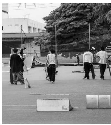
外国籍の子供に本市の教育を