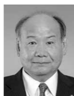
党 明 公 内 田 彰