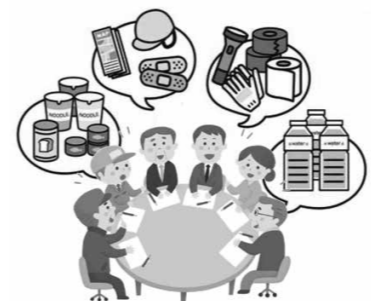
行政区と連携した防災備蓄品の管理を