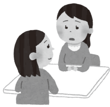
児童・生徒に寄り添った事業を