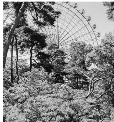
魅力ある自治体ブランディング戦略を