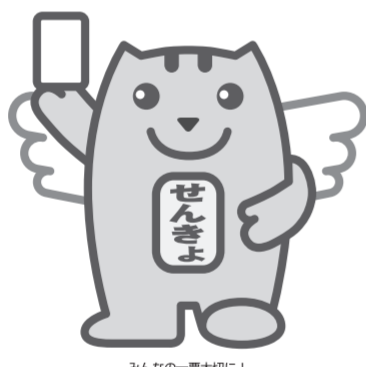
みんなの一票大切に！