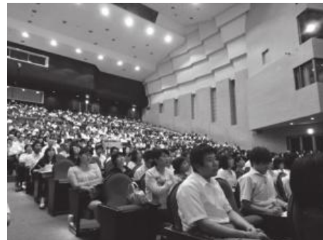
教職員全体研修会