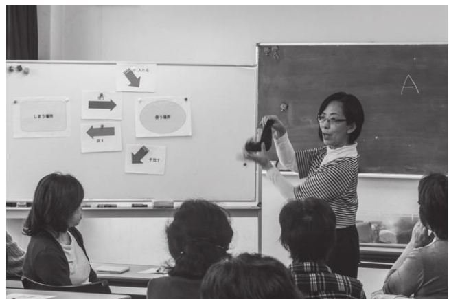
公民館事業（捨てられない人のためのお片づけ講座）