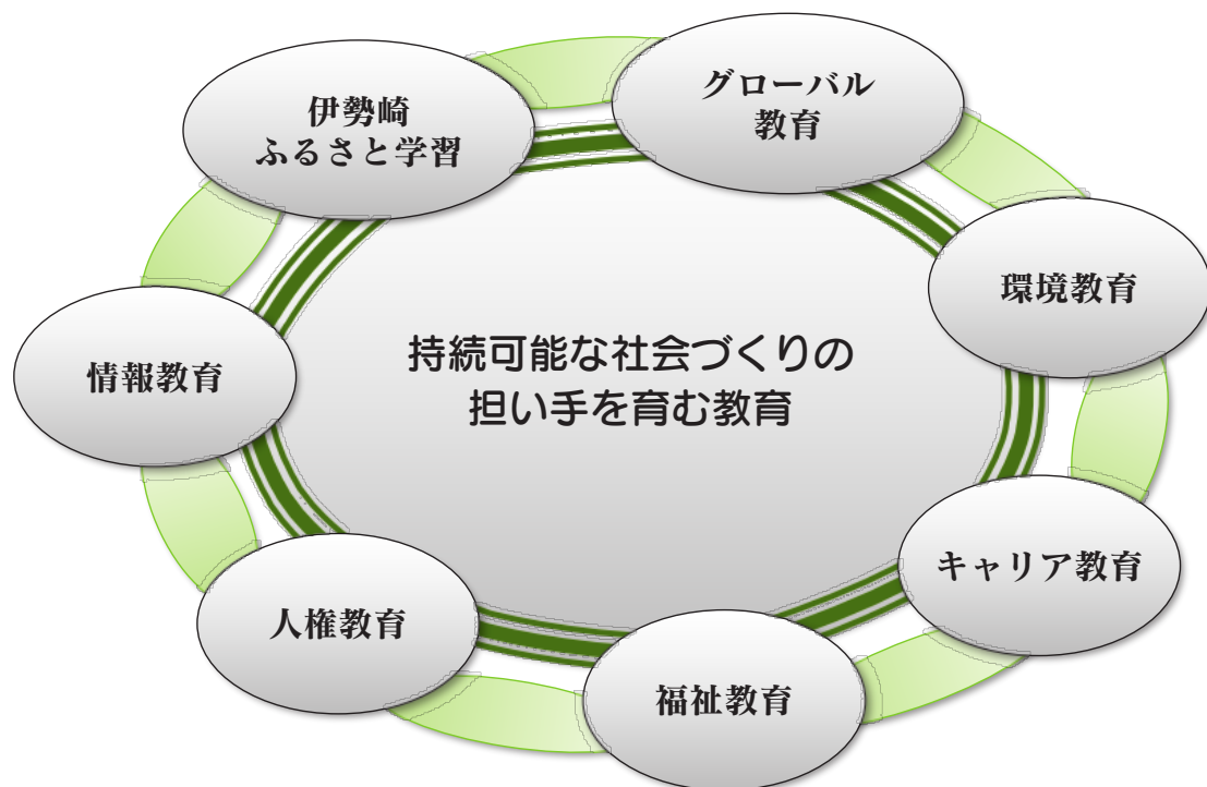
伊勢崎市の教育イメージ図

これらの人材を育成するため幅広い視点から、グローバル教育、環境教育、キャリア教育など関連する様々な分野に総合的に取り組みます（イメージ図）。その具体的手段として、家庭や学校、地域が連携を深め、より広い世代交流の中から、個別にもつ知識や能力等を伝え合う“対話的な学び”の事業展開によって、 市民が夢や生きがいを持って学び、その成果を地域や社会に還元できる仕組みづくり を推進します。