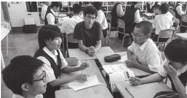
スプリングフィールドからの留学生を交えた英語授業 (あずま中学校)