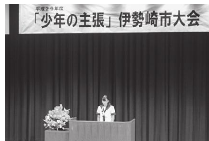
少年の主張伊勢崎市大会（宮郷中学校）