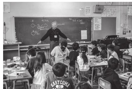
放課後子ども教室（南小学校）