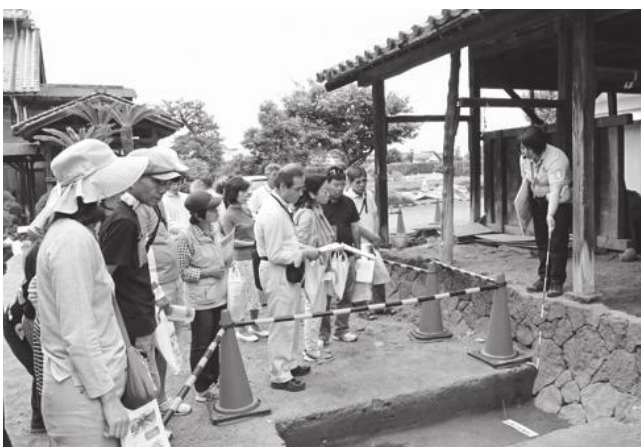
田島弥平旧宅発掘調査現地説明会