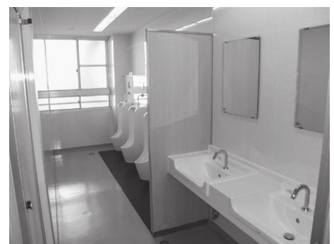
トイレ改修（第二中学校）