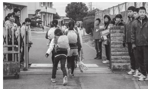
小中合同あいさつ運動（境北中学校）