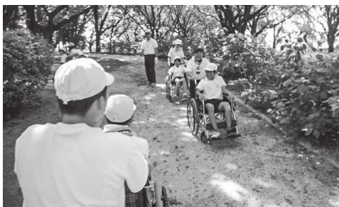
車椅子体験（境剛志小学校）