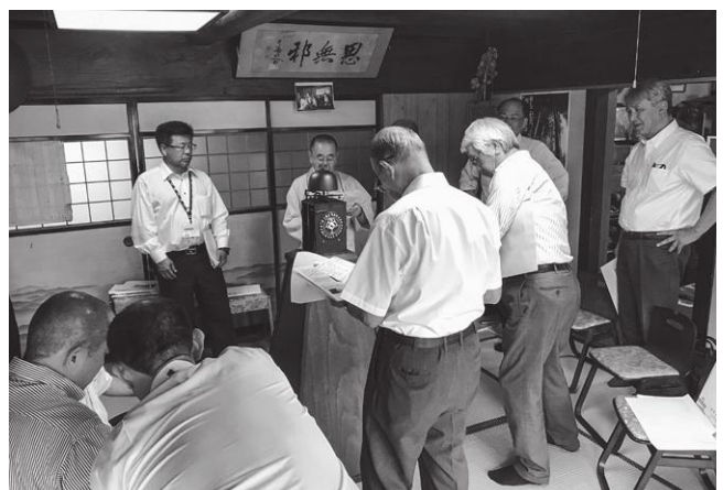
文化財調査委員による新指定候補物件の調査（福壽院の和時計）