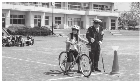
交通安全教室 (赤堀東小学校)