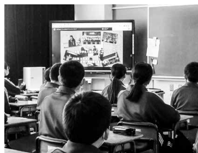
電子黒板 (第三中学校)