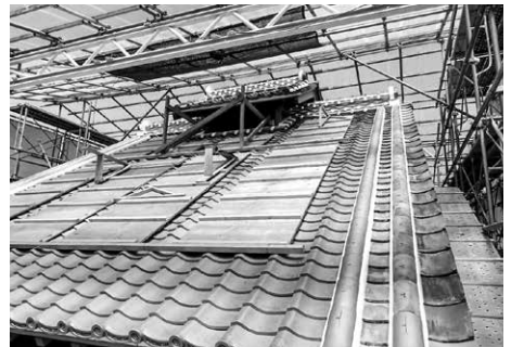
田島弥平旧宅別荘の修復整備工事