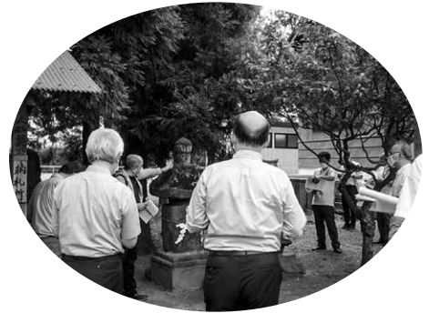
文化財調査委員会現地調査 (波志江愛宕神社の宝塔)