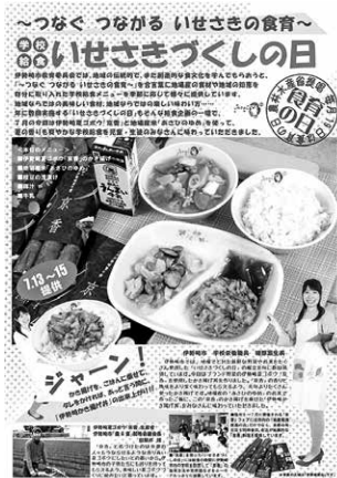
いせさきづくしの日