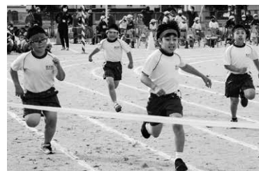
運動会 (三郷小学校)