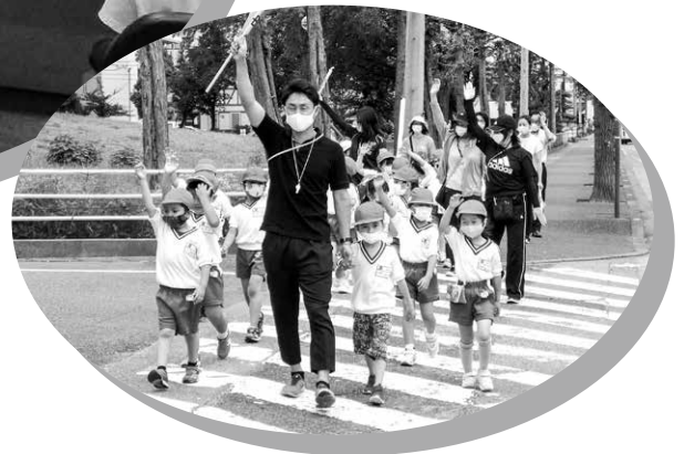
交通安全教室 (坂東小学校)