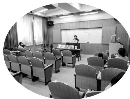
読書感想文の書き方講座