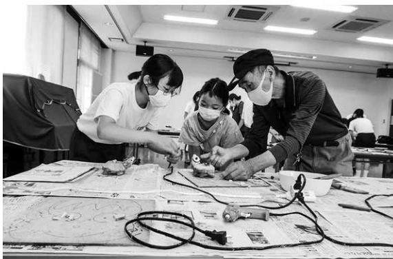
学社連携事業 (殖蓮公民館 間伐材工作講座)