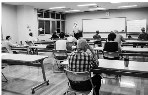
まなびい先生 自主企画事業 (学び直し日本史)