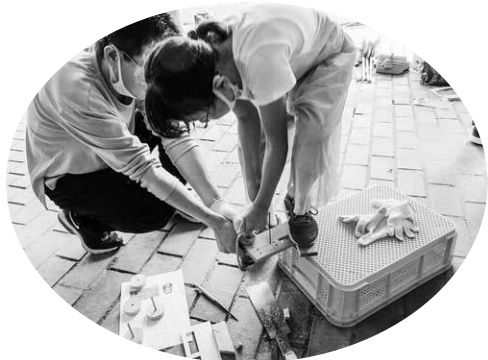
まゆドーム (木工カーを作ろう)