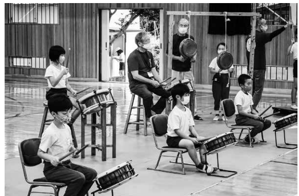
放課後子供教室 (境東小学校)