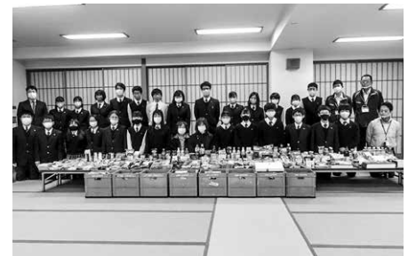
SDGs フードドライブの取組

*SDGs(エス・ディー・ジーズ)とは「持続可能な開発目標」 世界が2016年から2030年までに達成すべき17の環境や開発に関する国際目標