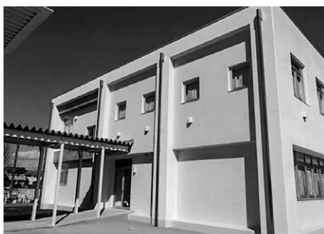
校舎増築工事 (あずま小学校)