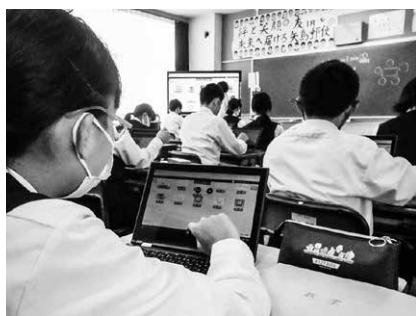
タブレット (第三中学校)