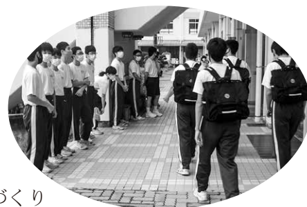
挨拶運動 (境南中学校)