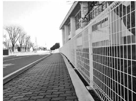
ブロック塀改修工事 (赤堀小学校)