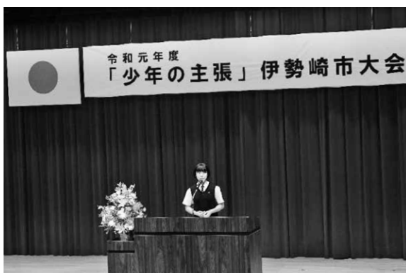
少年の主張伊勢崎市大会