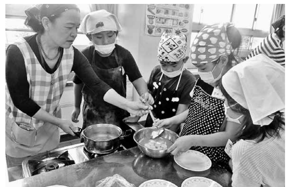
放課後子供教室 (赤堀東小学校)