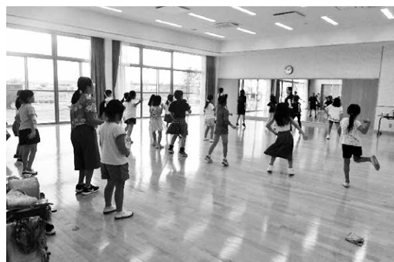
宮郷放課後公民館教室 わくわくみやごう