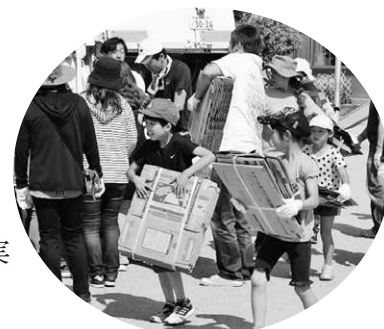
保護者と児童による廃品回収 (殖蓮小学校)