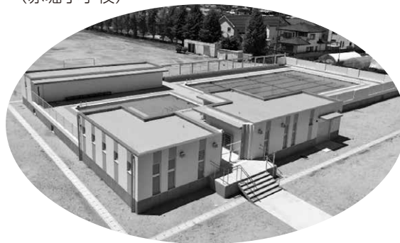
プール新築工事 (名和小学校)