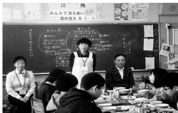
給食時訪問 (坂東小学校)