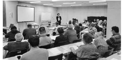
いせさき学習堂 郷土文化講座