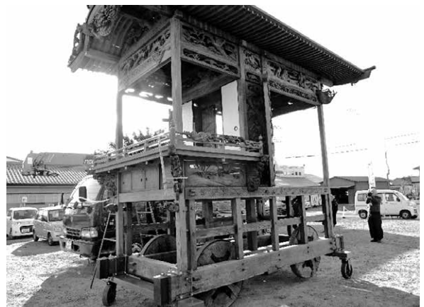
茂呂の屋台修復事業