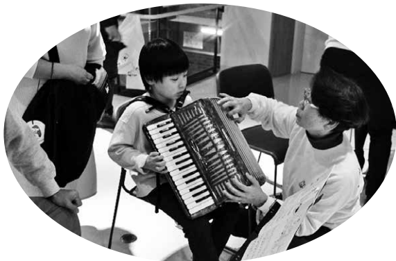
学社連携事業 (ふれあい音楽教室)