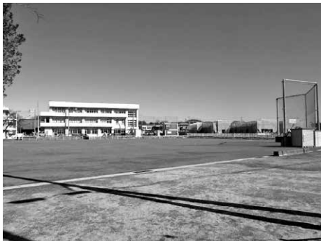
グラウンド拡張工事 (赤堀小学校)