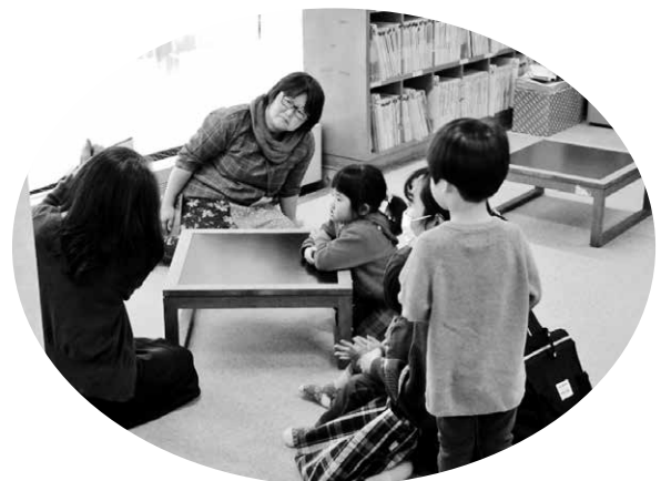
図書館での読み聞かせ