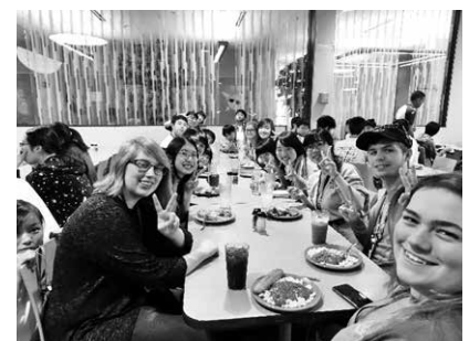
海外グローバルリーダー研修

*SDGs(エス・ディー・ジーズ)とは「持続可能な開発目標」 世界が2016年から2030年までに達成すべき17の環境や開発に関する国際目標