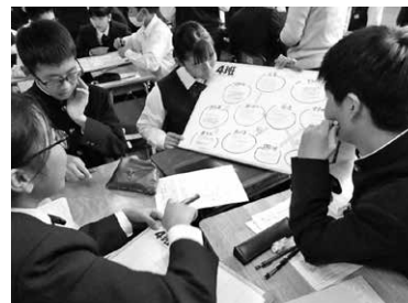
授業での意見交流 (第三中学校)