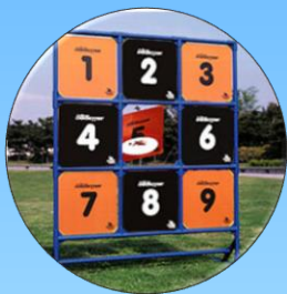
ディスクゲッター