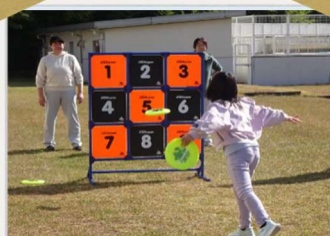
ディスグッターナイン

南小学校にて、ディスグッターナイン・ジャベボール・ボッチャ・ラダーグッターを体験しました。軽スポーツを通して世代を超えた交流が生まれ、大盛況の一日となりました。 参加の皆さまおつかれさまでした！