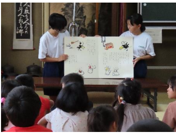
夏休み読み聞かせ講座

これまでも公民館講座の講師補助などのボランティアをしてくれた第二中学校の生徒の皆さんが、今年度一気に再開された納涼祭等の地区行事でもスタッフとして、また文化祭への作品出展でも活躍してくれました。一緒に参加した地域の人々から、「若い人が頑張ってくれて頼もしい。」「積極的に動いてくれて助かる。」「立派な作品を見て刺激を受けた。」等の感想が寄せられ、中学生も「役に立てて良かった、また参加したい。」と話してくれました。学校と地域が相互に連携し、大人も子供も一緒に学び合い、「地域全体を元気にし、社会をよりよくしていく」活動を進めています。来年度の講座や事業でも皆さまのご参加をお待ちしています！！