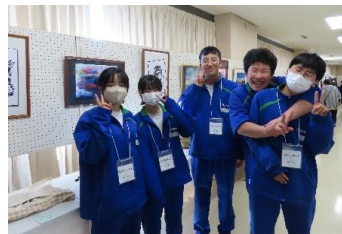
名和地区住民文化祭