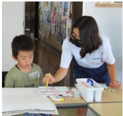
夏休み子ども絵画教室