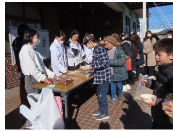
お正月もちつき教室(名和地区子ども会育成会共催)