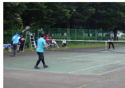
昨年のテニス大会