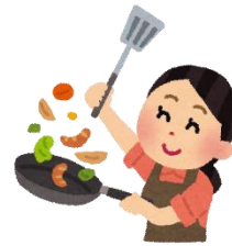
伊勢崎市食生活改善推進協議会