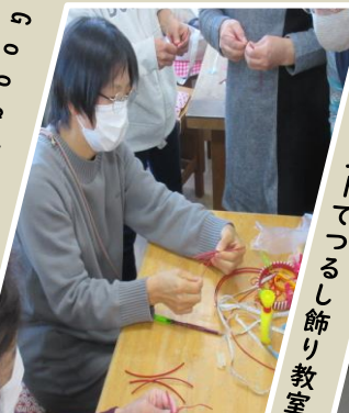
クラフトバンドでつるし飾り教室