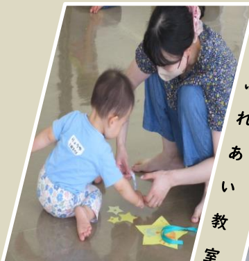
親子ふれあい教室