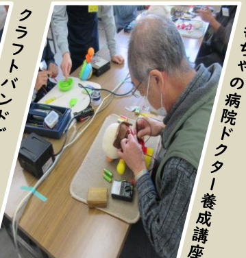
おもちゃの病院ドクター養成講座