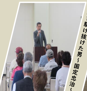
幕末を駆け抜けた男！国定忠治