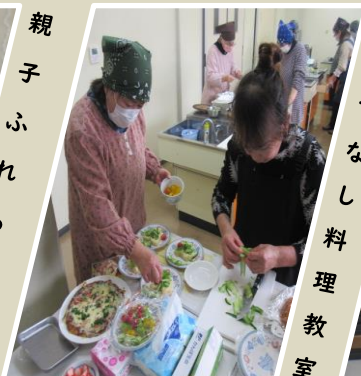
おもてなし料理教室