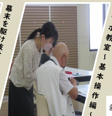
スマホ教室、基本操作編

あずま公民館では、今年度も幅広い種類の講座を実施してまいりました。また、子どもクラブでは、あずま中学校の生徒の皆さんに協力してもらい、6つの学社連携事業を行うことができました。来年度も住民の皆様への生涯学習・社会教育推進の場として様々な講座を行ってまいりますので、ぜひご参加ください。