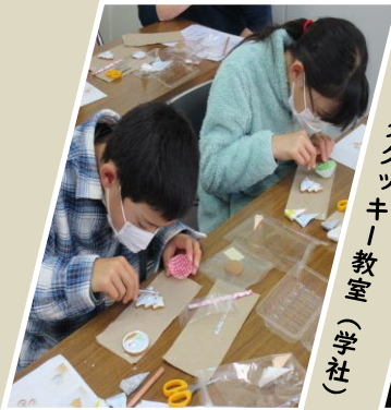
アイシングクッキー教室(学社)