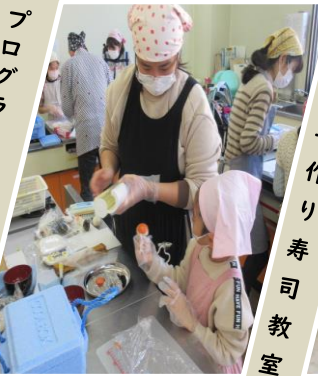
親子の手作り寿司教室