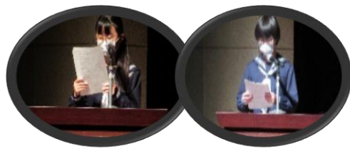
司会進行は境北中のボランティアさんです