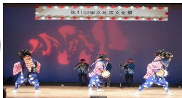
東新井獅子舞保存会