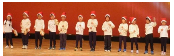
境いよく保育所 メリークリスマス（合奏）