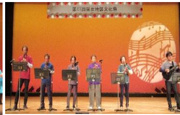
インディアンフルーツ伊勢崎