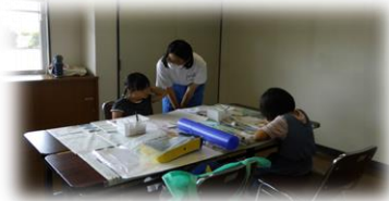
夏休み子ども絵画教室