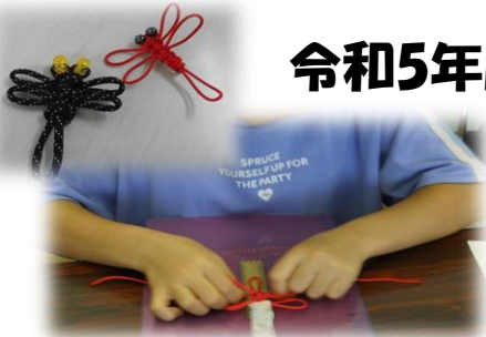
夏休み子ども花結び教室