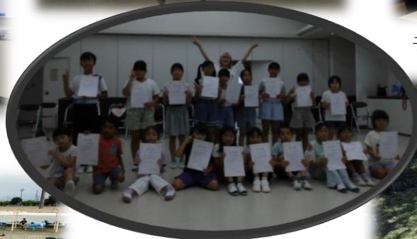
夏休み・冬休みキッズダンス教室(全4回)