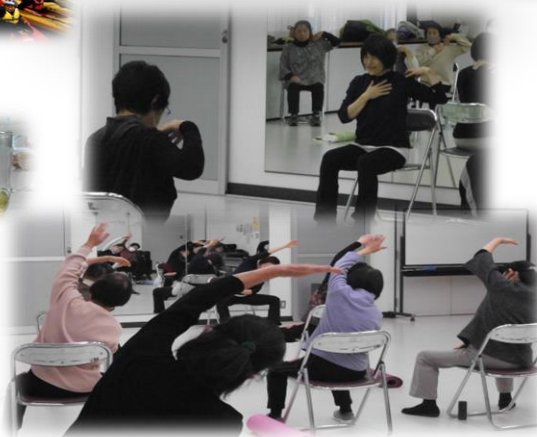
健康づくりを楽しもう(全6回)