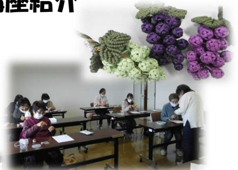
花結び講座(ぶどうのバックチャームをつくろう)