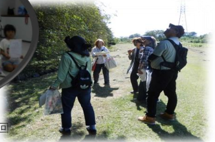
御嶽山の秋を楽しもう