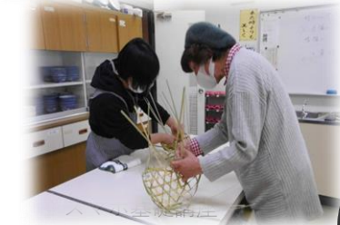
竹細工教室(竹かごをつくろう)