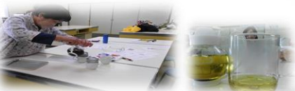
癒しのアロマ&ハーブ教室