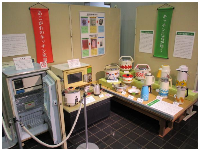
昭和40年代の花柄の電子ジャーや魔法瓶

本展示では、当館で所蔵する大量消費時代の原点ともいえる昭和30年代から40年代の高度経済成長期の家電製品を中心とした「昭和レトロ」を通じ、5GやIoT時代を迎えた私たちのこれまでのライフスタイルの変化と原点を振り返ります。