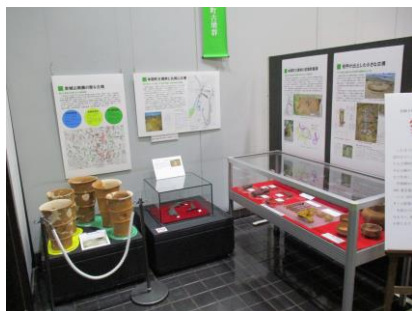
2号墳の副葬品の展示

100基以上の古墳で構成された本関町古墳群の中でも、本関町古墳群2号墳(H22伊勢崎市調査)は、5世紀末に造られた直径12mの小規模な円墳です。この古墳の埋葬施設は粘土で覆われた木棺が採用され、重要な威信財として短甲(たんこう・よろいのこと)をはじめ武器類や農具類の鉄製品が副葬され注目されます。短甲の存在はヤマト王権との関わりを示す極めて重要な資料です。2号墳は小規模な古墳ながら、そこに埋葬された人物は短甲という明確な優位性を示しています。