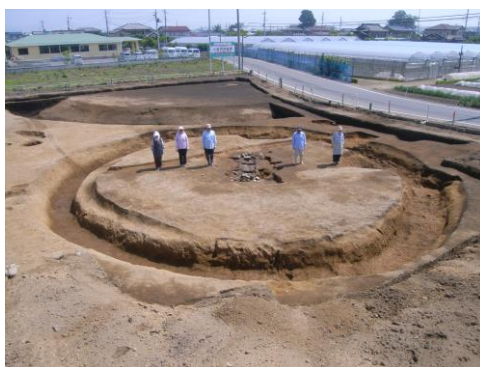
本関町古墳群2号墳 12mの小さな古墳