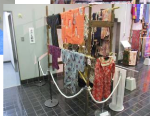
子どもの銘仙も展示