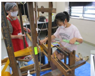
高機を使ってコースターを織りあげます。