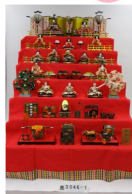
昭和48年の七段飾り