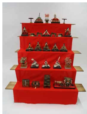
昭和17年の五段飾り