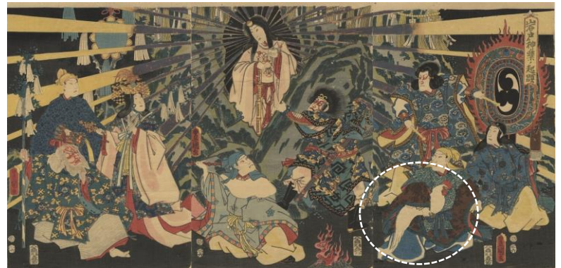
歌川国貞 安政4年(1857)『岩戸神楽ノ起頭』

朝を告げる鶏は、太陽を呼び、邪悪を払う神聖な鳥と考えられていました。『古事記』や『日本書紀』の「天の岩戸」では、天照大神が岩戸の中に隠れてしまったため、世界は真っ暗になります。神々は鶏の鳴き声で、天照大神を岩戸から誘い出そうとする話からも、ハニワになった鶏の重要性がうかがえます。下の絵は、「天の岩戸」の物語を江戸時代に描いたものですが、しっかり鶏が描かれています。