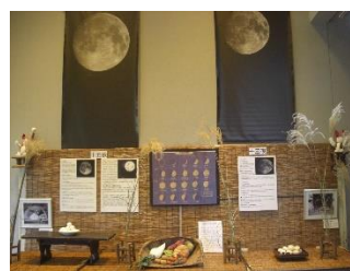
過去の展示の様子