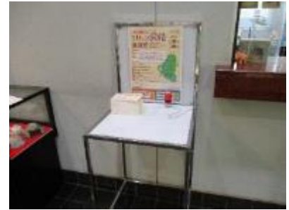
設置したスタンプ台