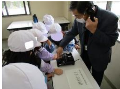
黒電話の体験の様子