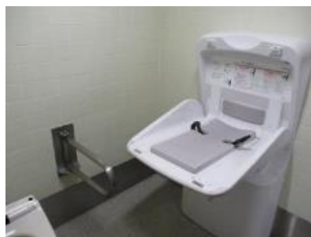
設置したベビーシート