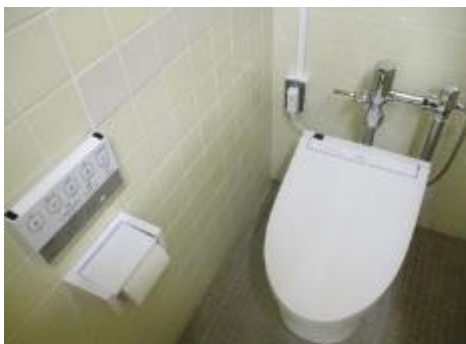
工事後の洋式トイレ

1階ホールの展示用壁フック修繕、女子トイレの洋式化、タイル剥離による一部張り替え、多目的トイレベビーシート設置工事を行った。