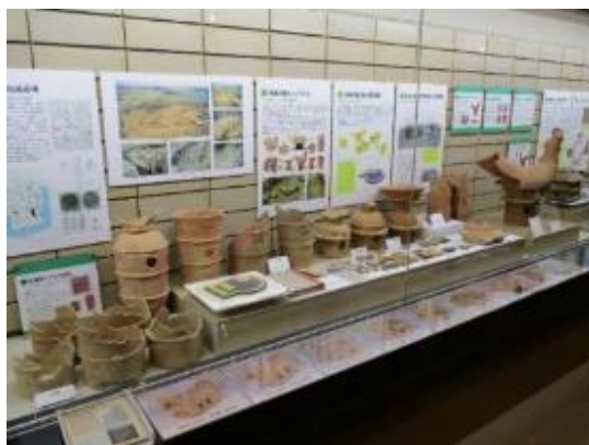
1階常設展示 赤堀茶臼山古墳

市指定史跡丸塚山古墳3号石棺（一部）、台所山古墳箱式石棺の他、市指定史跡毒島城の伝説にまつわる「毒臼」を屋外にて展示。