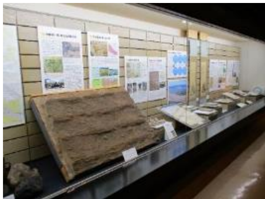
1階常設展示 伊勢崎藩を救え！天明3年浅間山大噴火