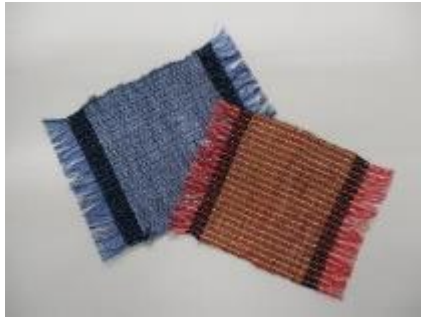
作成したコースター