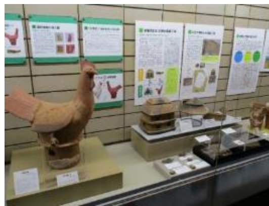
1階常設展示釜ノ口遺跡