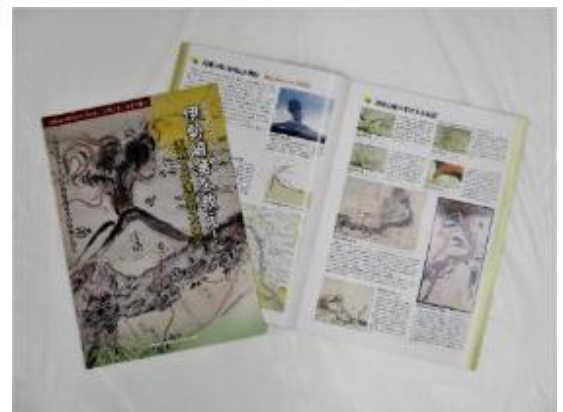
展示パンフレット