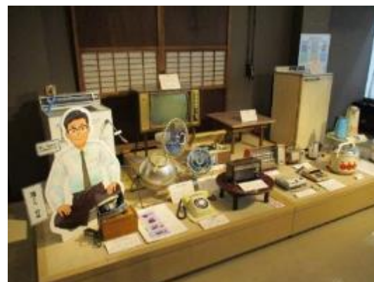
2階常設展示 清くんの家電生活