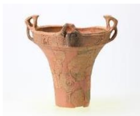
曲沢遺跡 加曾利 E II 式土器